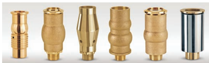
PF-3401 PF-3402 PF-3403 PF-3409 PF-3410 PF-3412